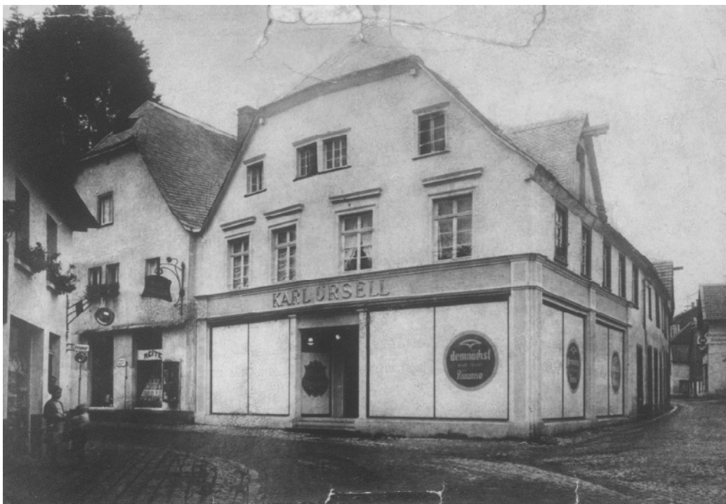
Die Familie Ursell betrieb an der Ecke Niederste Straße/Ennester Straße ein Textilgeschäft.

„Denn siehe, deine Feinde toben, und die dich hassen, erheben das Haupt.“ – „Wohl-an!“ sprechen sie, „lasst uns sie ausrotten, dass sie kein Volk mehr seien, und des Namens Israel nicht mehr gedacht werde.“ (Psalm 83). 1)