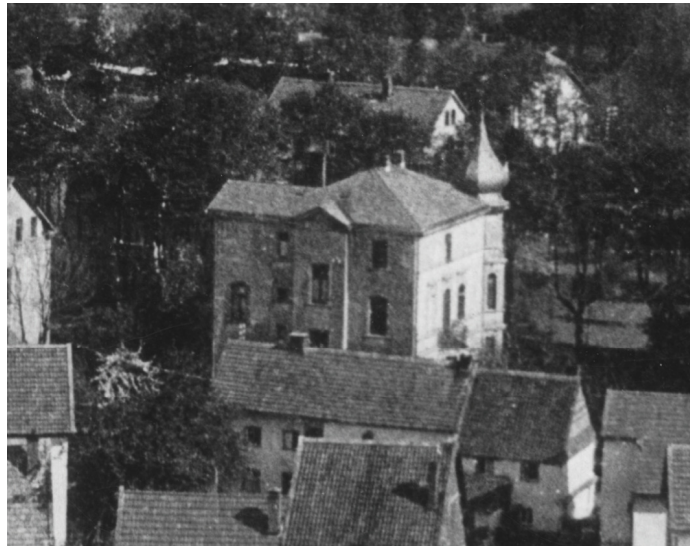
Blick vom Kirchturm auf die im Jahre 1900 errichtete Villa Stern am Ostwall.