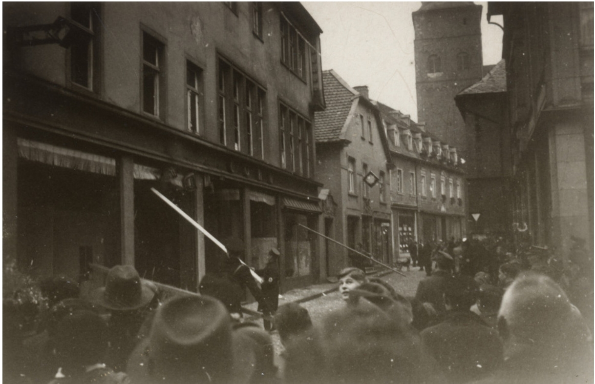
Am 10. November 1938, vormittags gegen 11.00 Uhr, wurden in Attendorn sämtliche Wohnungen und Geschäfte der jüdischen Familien zerstört. Das Foto entstand vor dem Haus Cohn in der Wasserstraße.