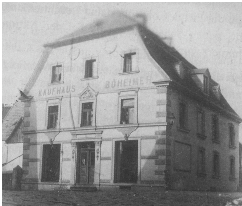
Das Kaufhaus Böheimer in der Breiten Techt.