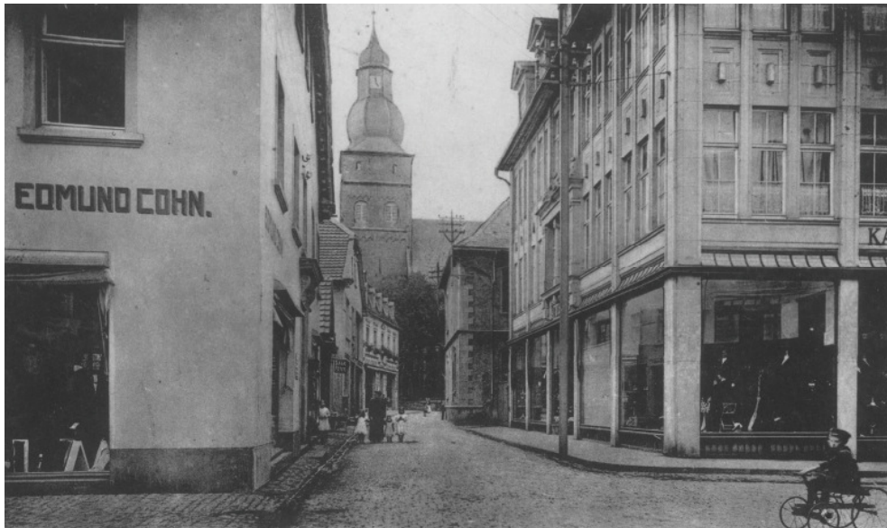
In der Wasserstraße lagen die jüdischen Kaufhäuser Cohn und Lenneberg direkt gegenüber. Beide Gebäude stehen noch heute.